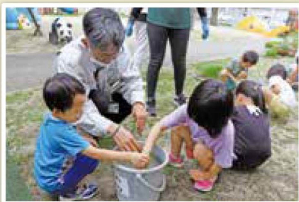
▲6月25日(火)両開保育園バケツ稲植え