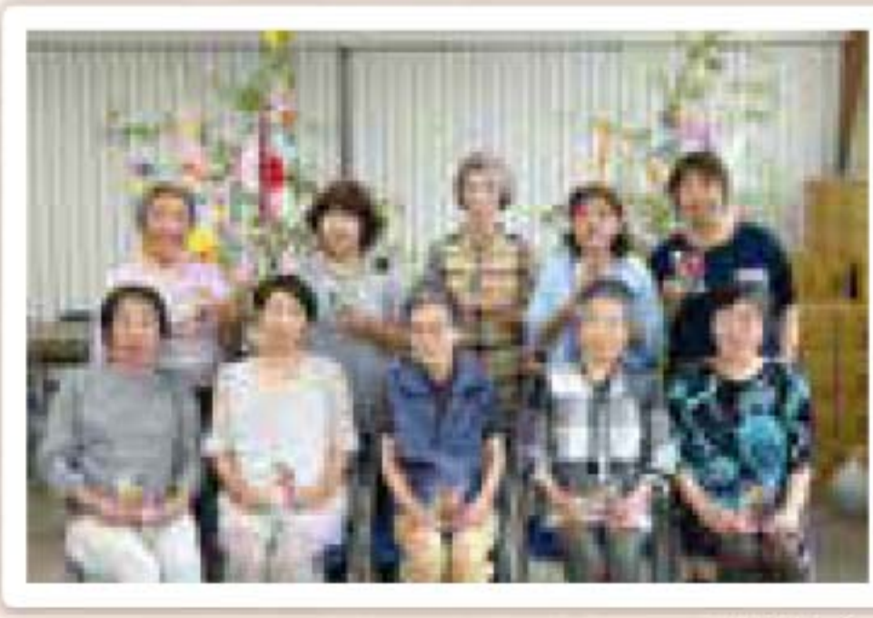
6/28(金)大和・血垣開地区