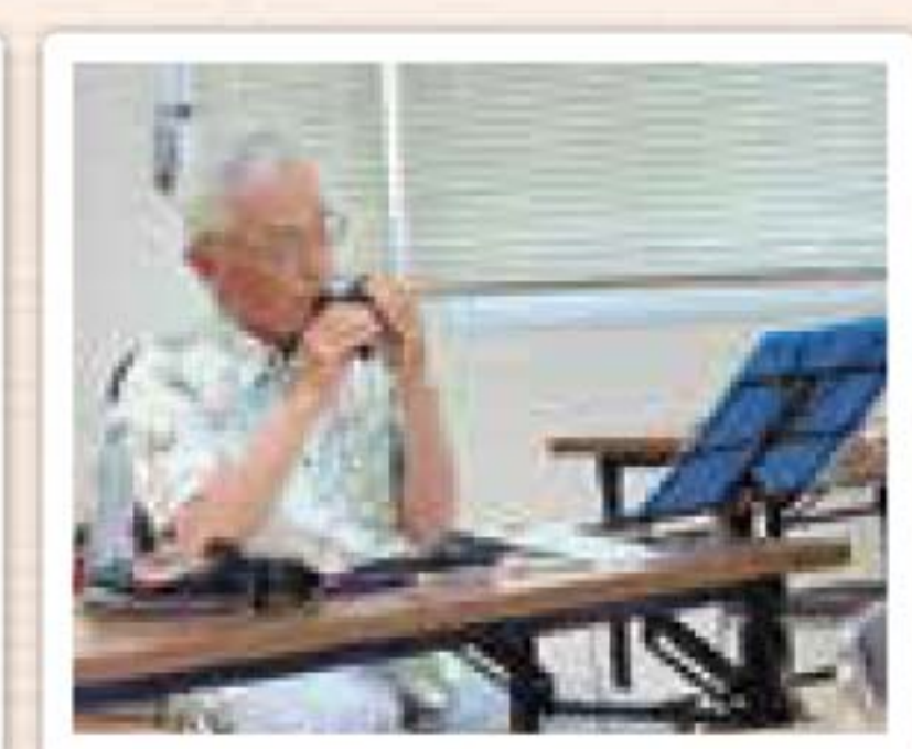
オカリナ演奏も聴きました。