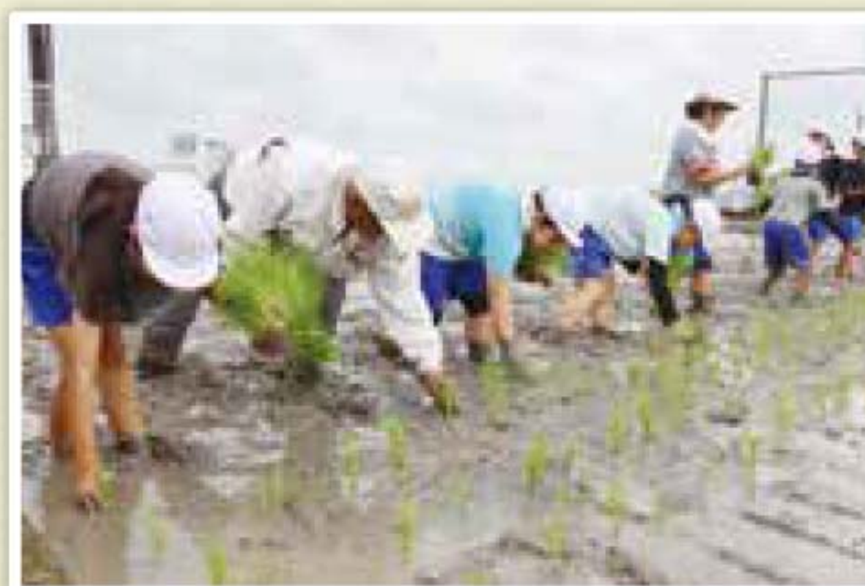
▲6月26日(水)両開小学校田植え