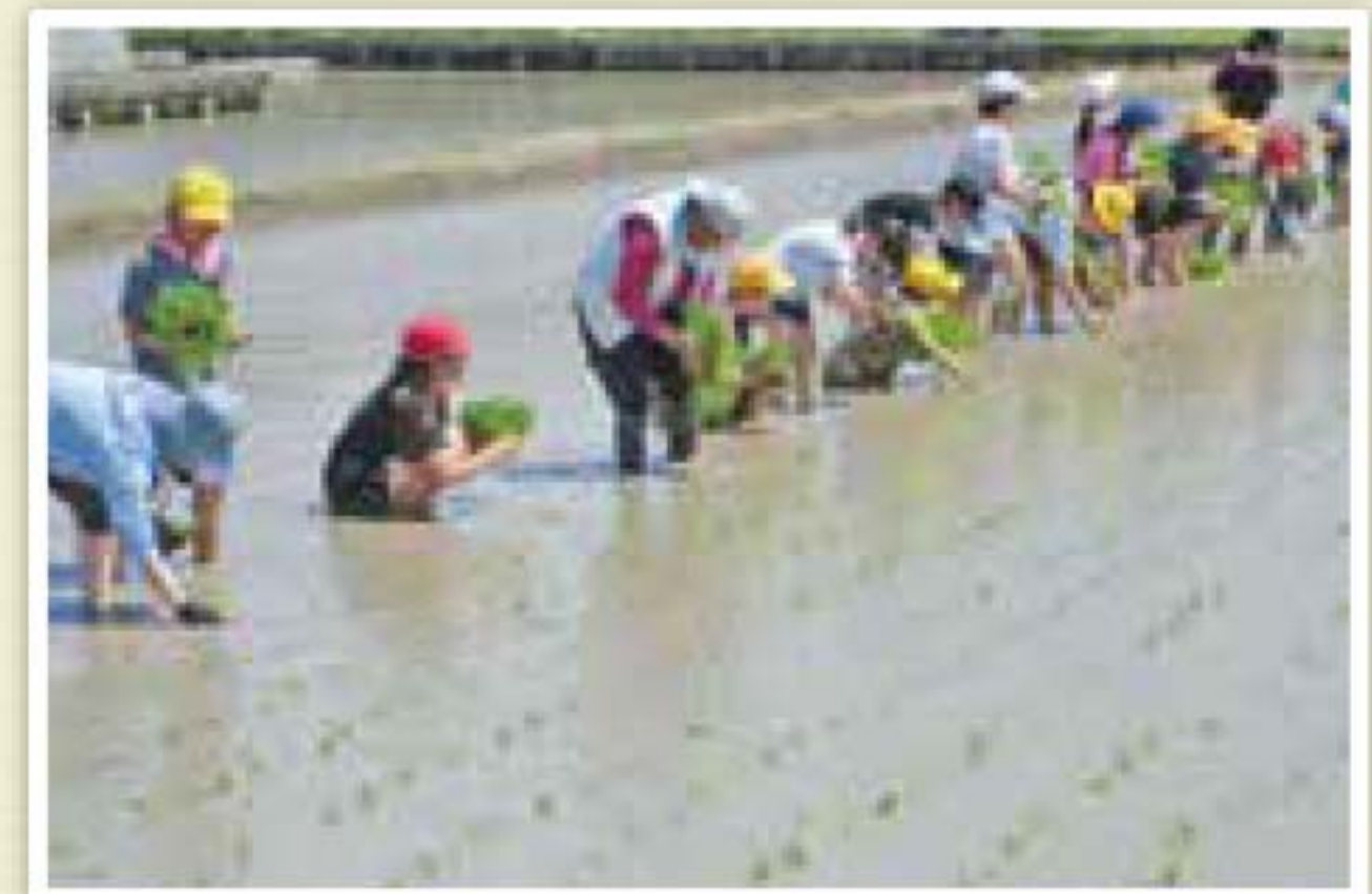
▲6月21日(金)ニッ河小学校田植え