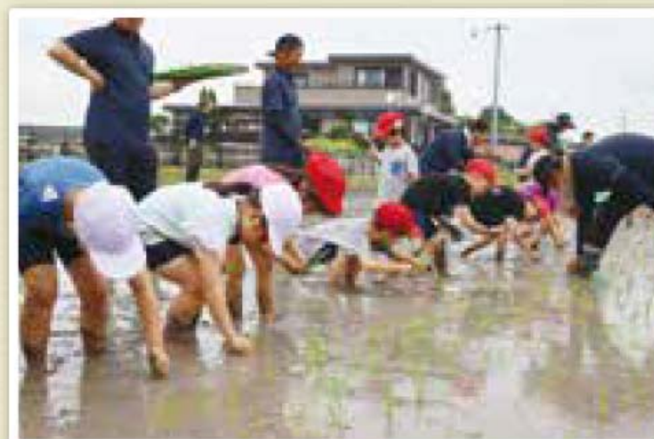
▲6月26日(水)有明小学校・宇土保育園合同田植え▲