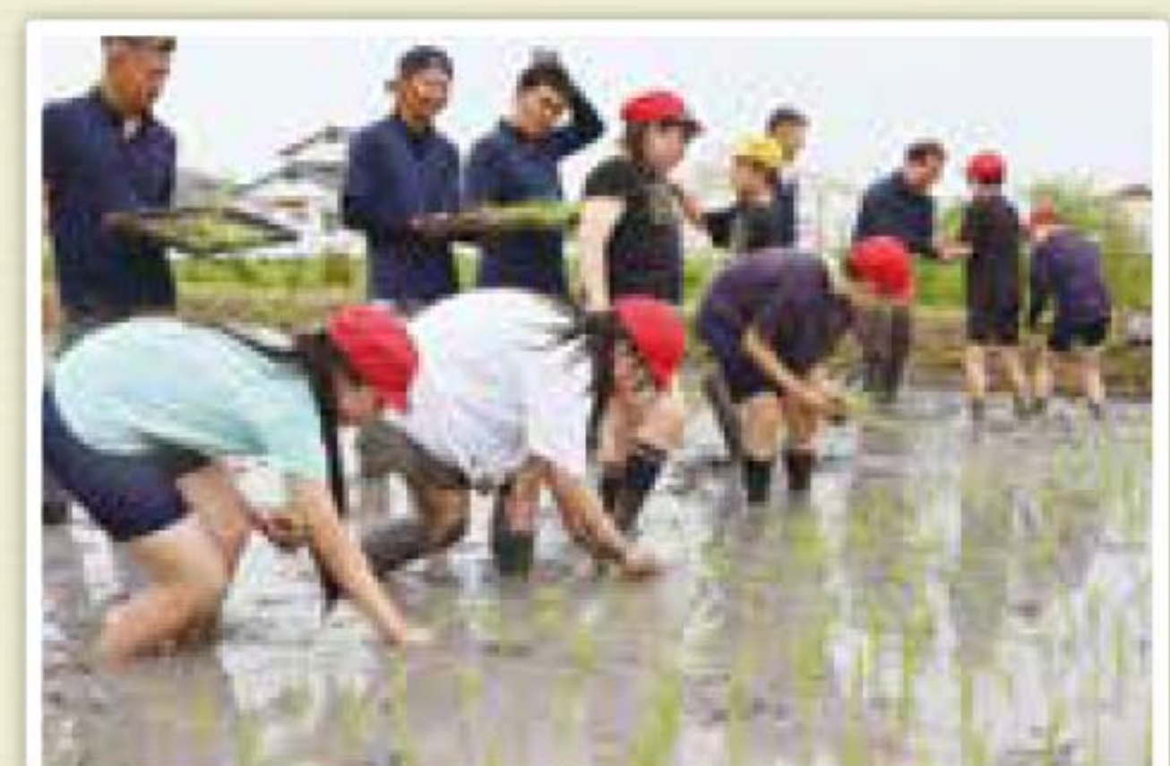
▲6月26日(水)皿垣小学校田植え