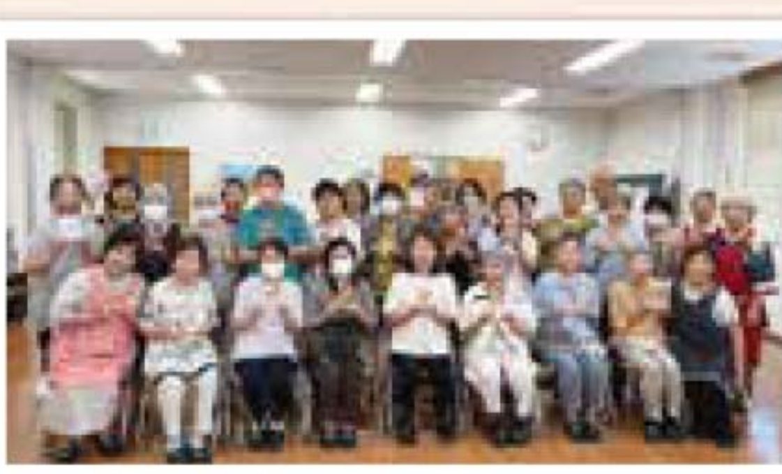
7/4(木)蒲池・昭代・柳川地区