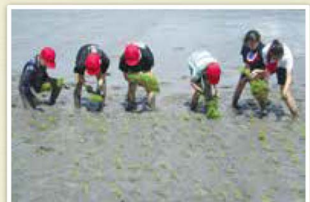
▲7月2日(火)大和小学校田植え