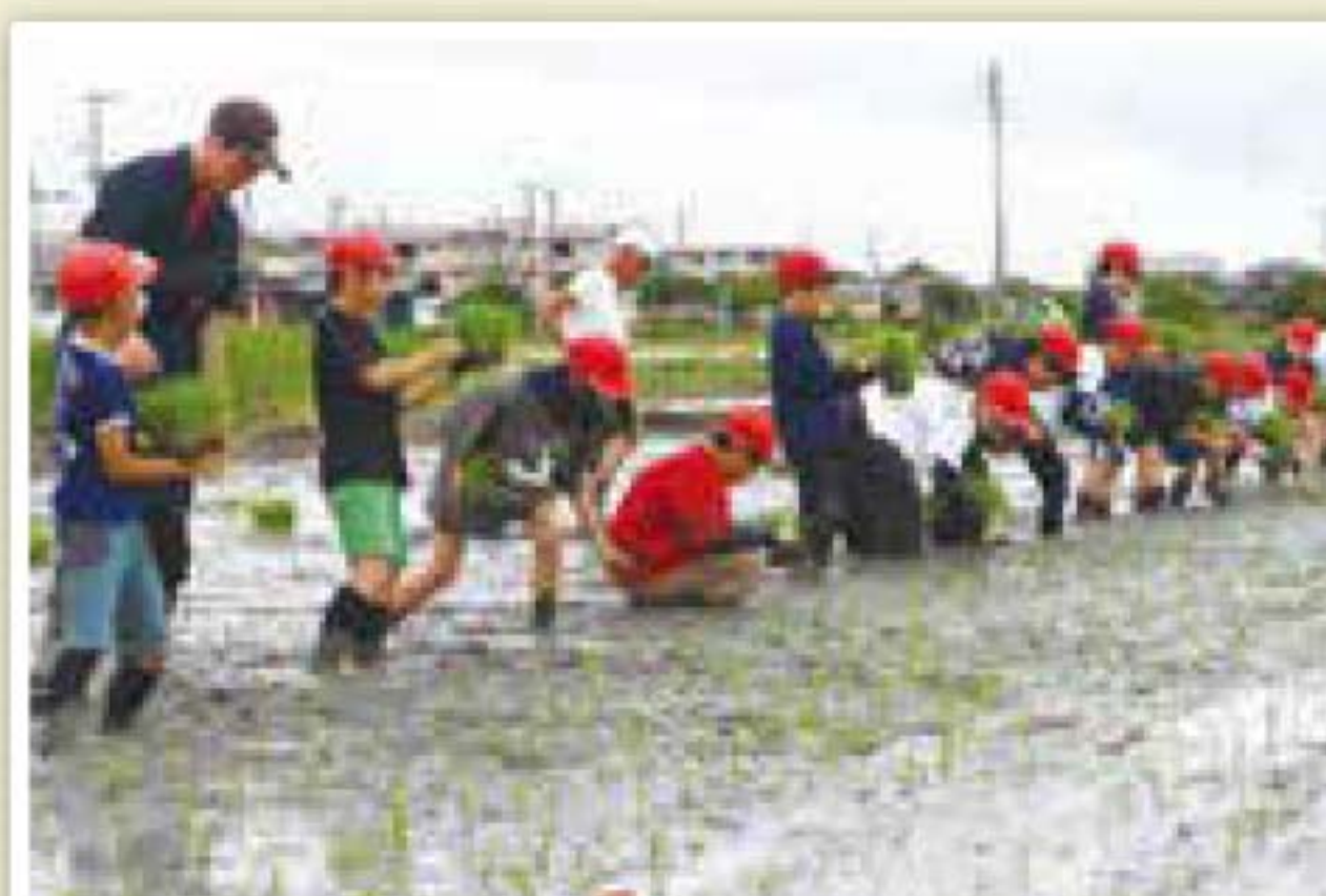
▲6月28日(金)矢留小学校田植え