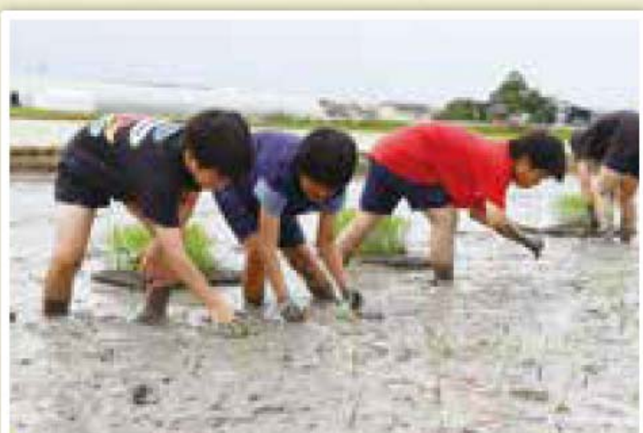
▲6月28日(金)昭代第一小学校田植え