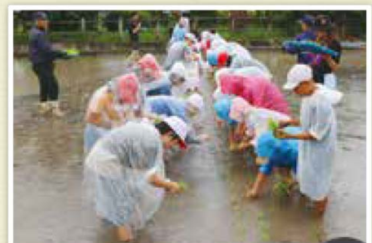
▲6月26日(水)蒲池小学校田植え